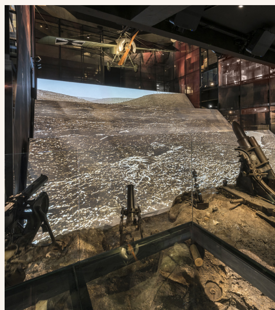
Espaces de visite du Mémorial de Verdun