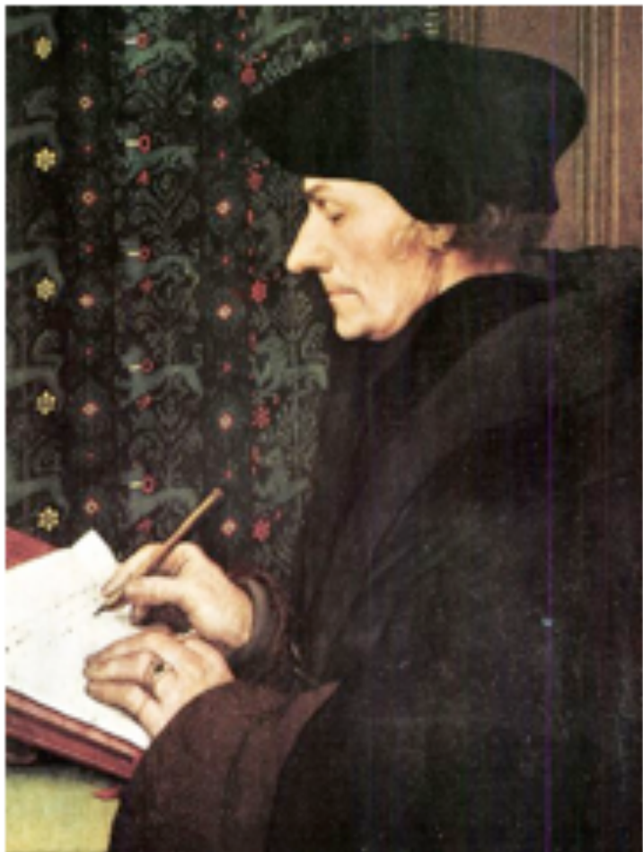
Portrait d'Érasme « Prince des Humanistes » par Holbein – 1523- (Musée du Louvre)