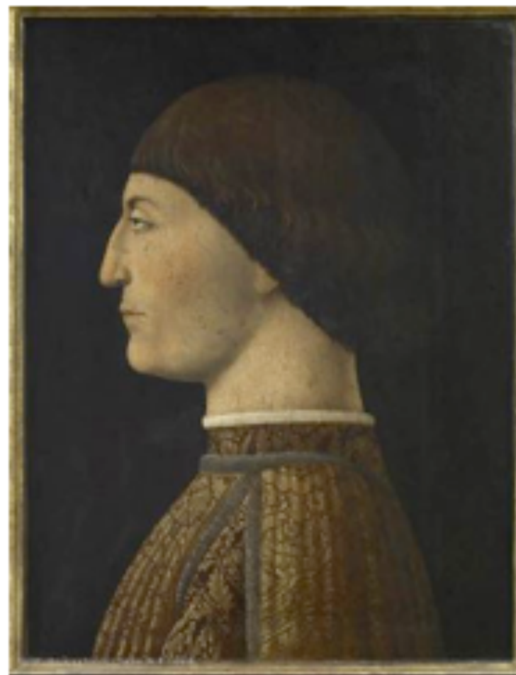
Portrait de Sigismondo Pandolfo Malatesta , seigneur de Rimini, par Piero de la Francesca – vers 1451

3/ Selon vous, que peut-on déduire des liens culturels et diplomatiques qu'entretiennent dès la fin du XVe siècle l'Empire ottoman et certains occidentaux, notamment les Vénitiens ?