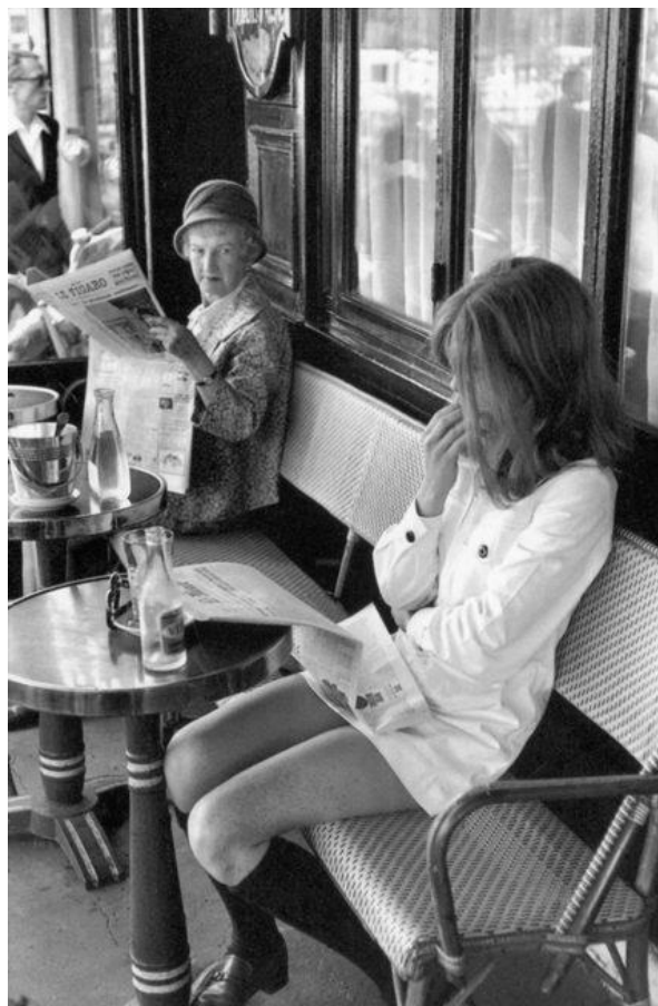
Henri Cartier-Bresson, A la terrasse de la brasserie "Chez Lipp" , 1969, Musée Carnavalet, Paris.