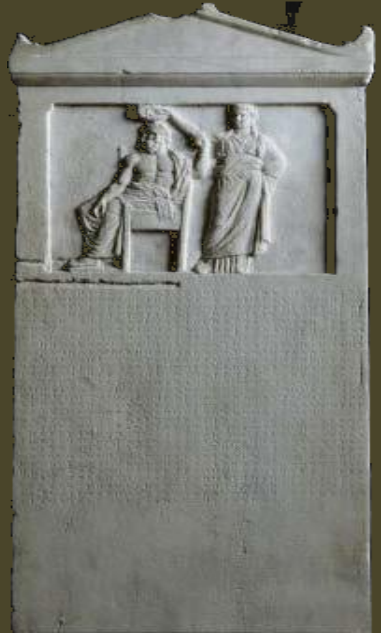
Stèle de marbre, la démocratie couronnant le peuple, 336 avant JC