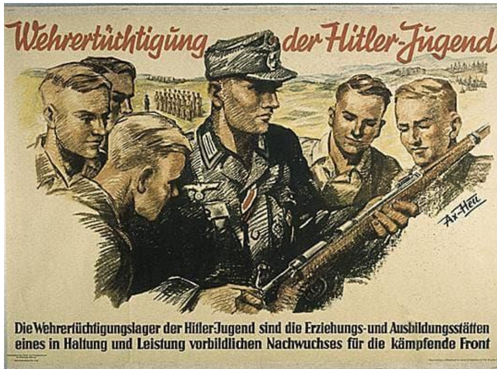
Affiche des Jeunesses hitlériennes, années 1930.

En haut : « L'entraînement militaire des Jeunesses hitlériennes »