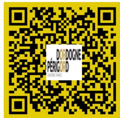
Vidéo de présentation « Cette année destination... la Dordogne Périgord ! »