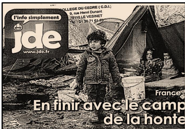
Une du Journal des enfants, janvier 2016 Photographie prise dans le camp de Grande-Synthe.