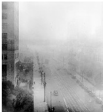
Première photographie du smog de Los Angeles en 1943.