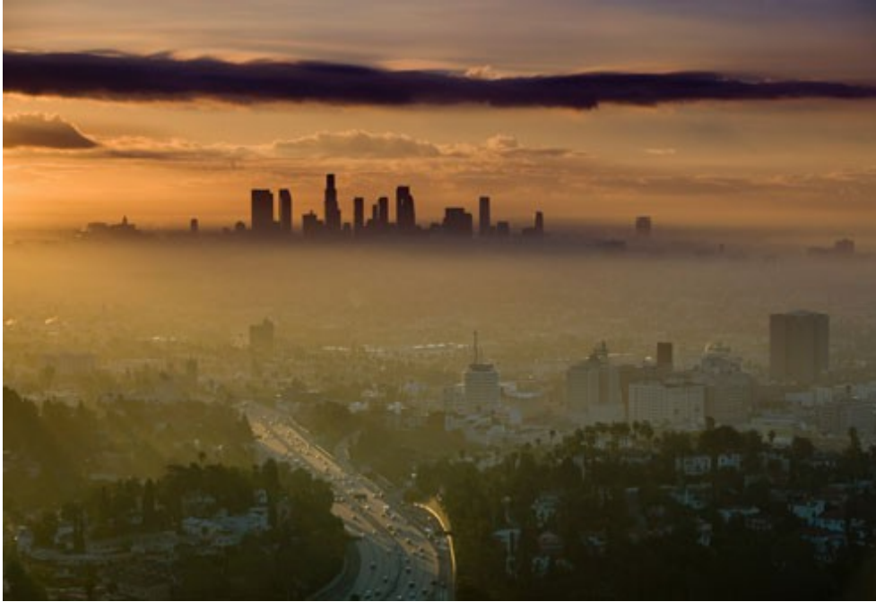
Le smog à Los Angeles de nos jours.