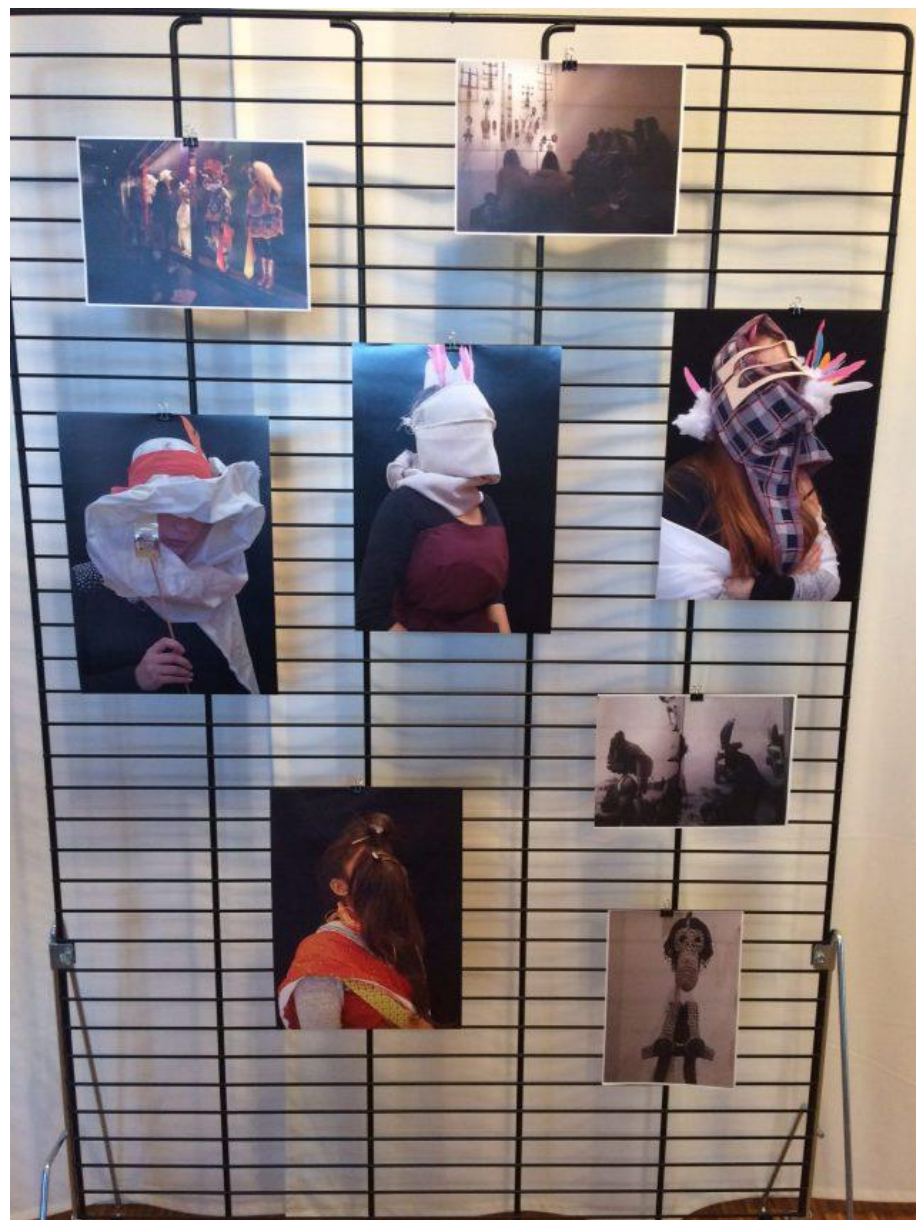
Travaux des lycéens exposés