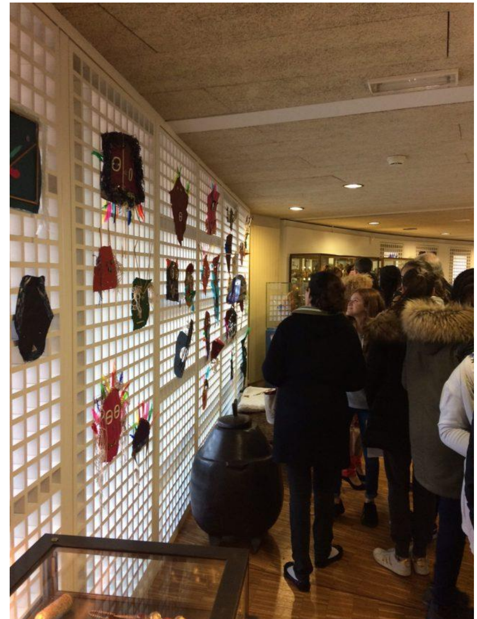
Exposition des masques au Musée Paul-Delouvrier