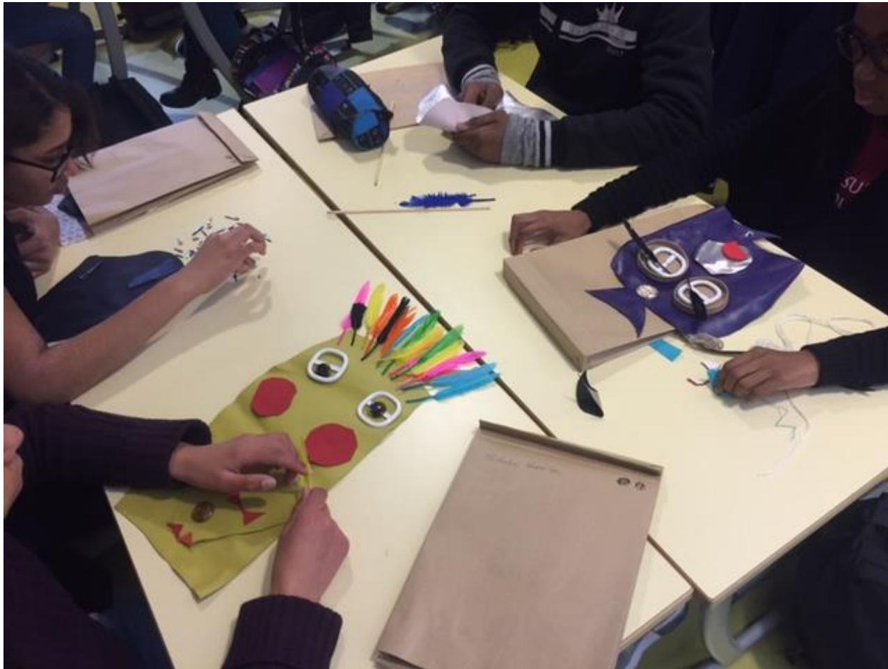
Séance de travail pour les collégiens