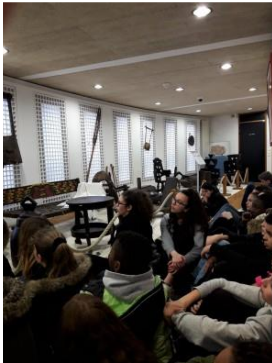
Les élèves du collège Rosa Parks au Musée Paul-Delouvrier afin de découvrir le lieu de l'exposition