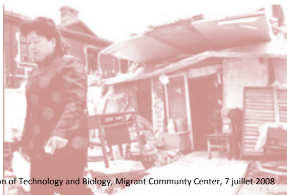
Bios (Web) Architecture at the Intersection of Technology and Biology, Migrant Community Center, 7 juillet 2008

Beaucoup des anciens magasins traditionnels que l'on trouvait auparavant sur la rue de Nankin ont disparu pour laisser place à des magasins de spécialités, des hôtels, des théâtres et des immeubles modernes. La rue de Nankin est entièrement consacrée au shopping. On y trouve, à côté de magasins qui proposent du jade, des montres, ou de la soie, de nombreuses enseignes internationales telles que Dunhill, Gucci ou encore Tiffany. La rue de Nankin est également bordée de nombreux bars et de restaurants surmontés d'enseignes lumineuses. On y trouve également de nombreux grands hôtels, pour la plupart récents et luxueux. (D'après Insecula, Guide Internet du voyageur)