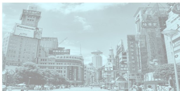
JDN Management: « Shanghai, une flamboyante renaissance économique »