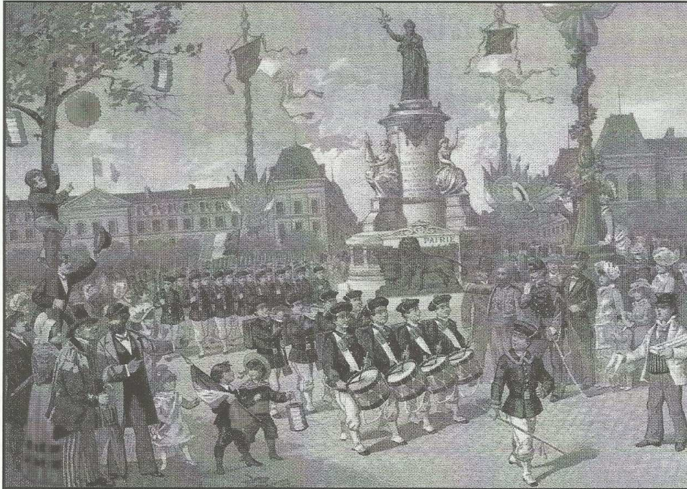
Lithographie anonyme, Paris, Musée Carnavalet.