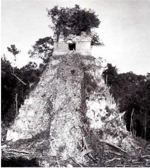
1/Templo en 1878 cuando «descubrieron» la ciudad de Tikal